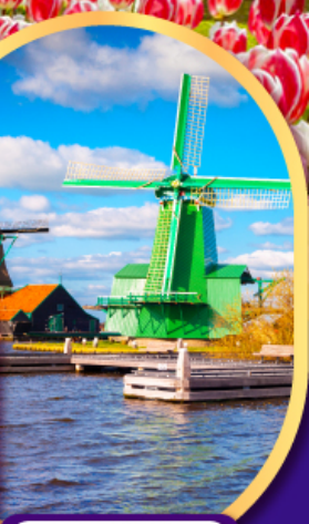
หมู่บ้านกังหันลมชาสคินส์