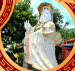
เจ้าแม่ทวนอิม วัดศีลขันธ์