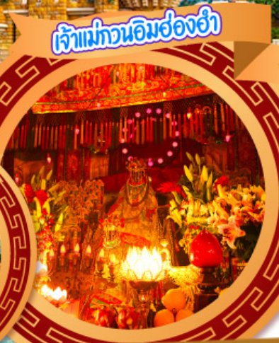
เจ้าแม่ทวนอิมฮ่องกง