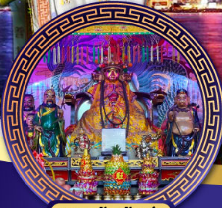
ศาลเจ้าหังเจีย