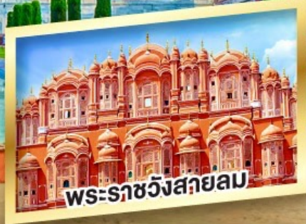
พระราชวังสกายลม