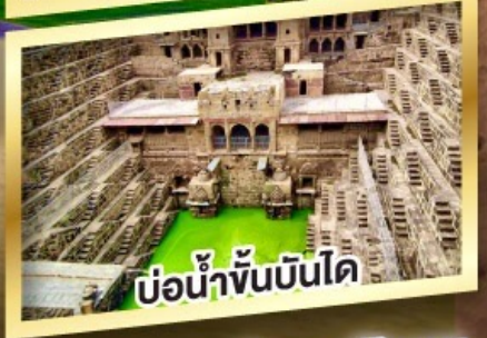
บ่อน้ำขั้นบันได