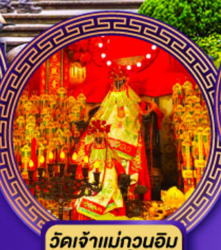
วัดเจ้าแม่กวนอิม ฮองฮ่า