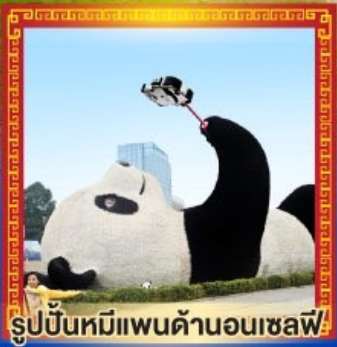
รูปปั้นหมีแพนด้าอนเซลฟี