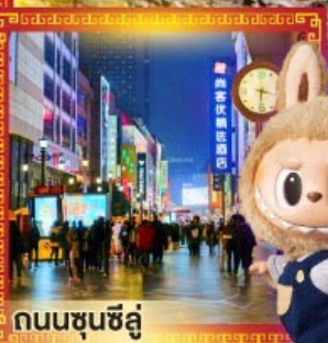
ถนนชุนชิว