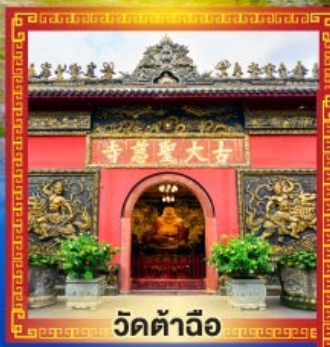
วัดต้าฉิว