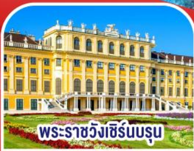
พระราชวังเฮ็ร์นบรูม