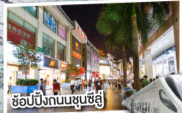
ช้อปปิ้งถนนชุนซีลู่