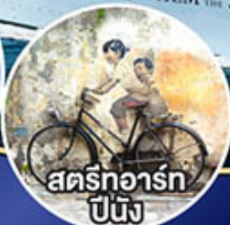
สตรีทอาร์ต ปีนัง