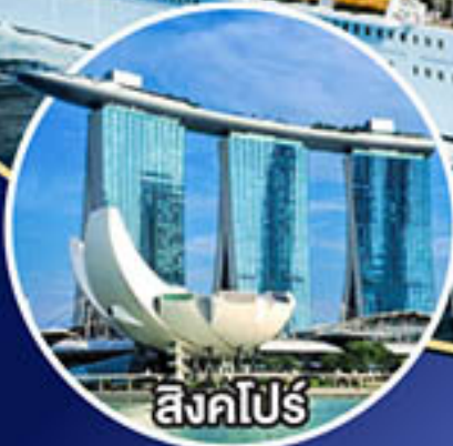
สิงคโปร์