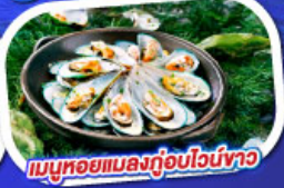
เมนูหอยแมลงภู่อูบไวน์ขาว