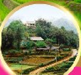
หมู่บ้านก๊อตก๊ต