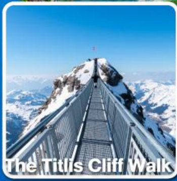
The Titlis Cliff Walk