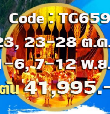
โซว์ทิเบต