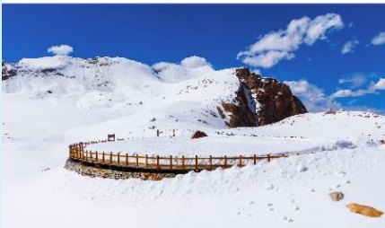
อุทยานตำกูปิงชวน