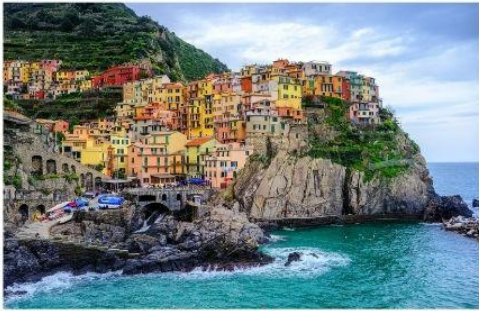
ซิงควิ เทเร

Cinque Terre อ่านว่า ซิงควิ เทเร หรือแปลในความหมายตามภาษาอังกฤษก็คือ The Five Land แดนมหัศจรรย์ทั้ง 5 ที่ประกอบกันขึ้นมาเป็นดินแดนแห่งความงดงาม หมู่บ้านเล็กๆ 5 หมู่บ้านที่ซ่อนตัวอยู่ห่างไกลจากสายตาของคนภายนอก แผ่นดินที่ยากจะเข้าถึงได้โดยง่าย หมู่บ้านเล็กๆ 5 หมู่บ้านที่ตั้งเรียงอยู่มีห่างกัน