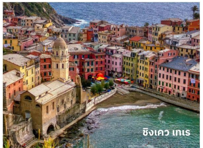
ซิงควิ เทเร

ท่านสามารถทำการสแกน QR CODE นี้ เพื่อรับชม “ซิงควิ เทเร” ในรูปแบบวิดีโอ