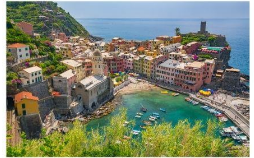
ซิงควิ เทเร

นำคณะเที่ยวชม ซิงควิ เทเร เป็นพื้นที่ที่ UNESCO ประกาศให้เป็นมรดกโลก ด้วยทำเลที่ตั้งของทั้งหมดอยู่บนภูเขาสูง โดมมีหน้าผาสูงชัน และทะเลกว้างใหญ่เป็นฉากหน้า ทำให้มีความสวยงามประดุจดั่งภาพวาด จึงเป็นอุปสรรคสำหรับผู้คนจากภายนอกในการที่จะเข้าไปให้ถึง แต่ในแง่ดีก็คือ หมู่บ้านทั้งห้ายังคงสภาพดั้งเดิมของมันมาได้ตั้งแต่ศตวรรษที่ 11 ประกอบไปด้วย Monterosso al Mare (มอนเตรอสโซ อัล มาเร), Vernazza (เวร์นาซซา), Corniglia (คอร์นิเลีย) , Manarola (มานาโรลา) และ Riomaggiore (ริโอมัจจอร์เร) **ทางบริษัทจะนำทุกท่านเที่ยวอย่างน้อย 1 จากใน 5 หมู่บ้าน**