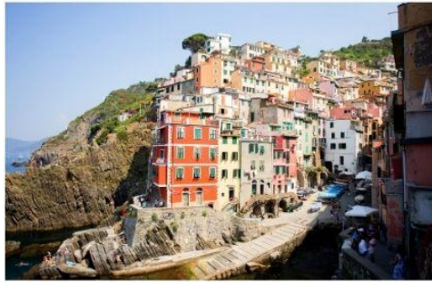
ซิงควิ เทเร