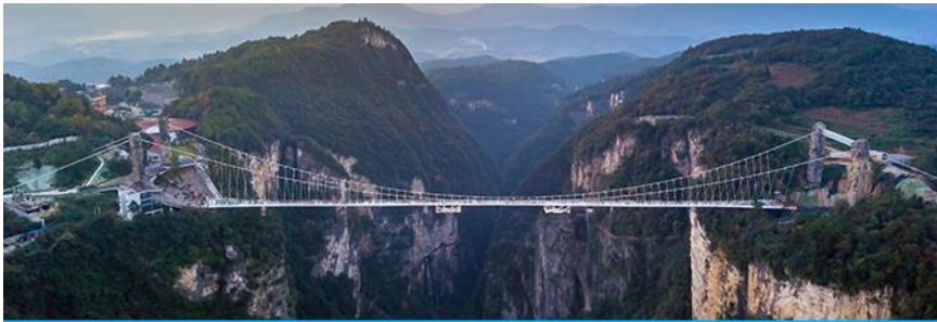
สะพานกระจกจางเจียเจี๋ย

อัตราค่าบริการสำหรับโปรแกรมเสริมการแสดงชุด The love Story of Wooden man and Fairy Fox ท่านละ 400 หยวน (หรือ 2,000 บาทขึ้นอยู่กับอัตราแลกเปลี่ยน) ระยะเวลาที่ใช้ในการเที่ยวชมการแสดง ประมาณ 3 ชั่วโมง รวมเวลาเดินทางไป กลับค่าบริการรวม ค่าบัตรเข้าชม ค่ารถรับ ส่ง และค่าน้ำเที่ยวของไกด์ท้องถิ่น พักที่ GUIYUANZHENPIN HOTEL โรงแรมระดับ 4 ดาวหรือเทียบเท่า