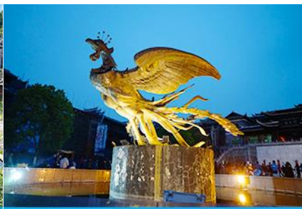
เมืองโบราณฟงหวง