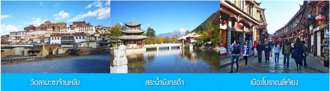
วัดลามะชวงจ้านหลิง

ที่พัก YUE GUANG HOTEL ระดับ 4 ดาว หรือเทียบเท่าเมืองจงเจี้ยน หรือเซงกาลีล่า