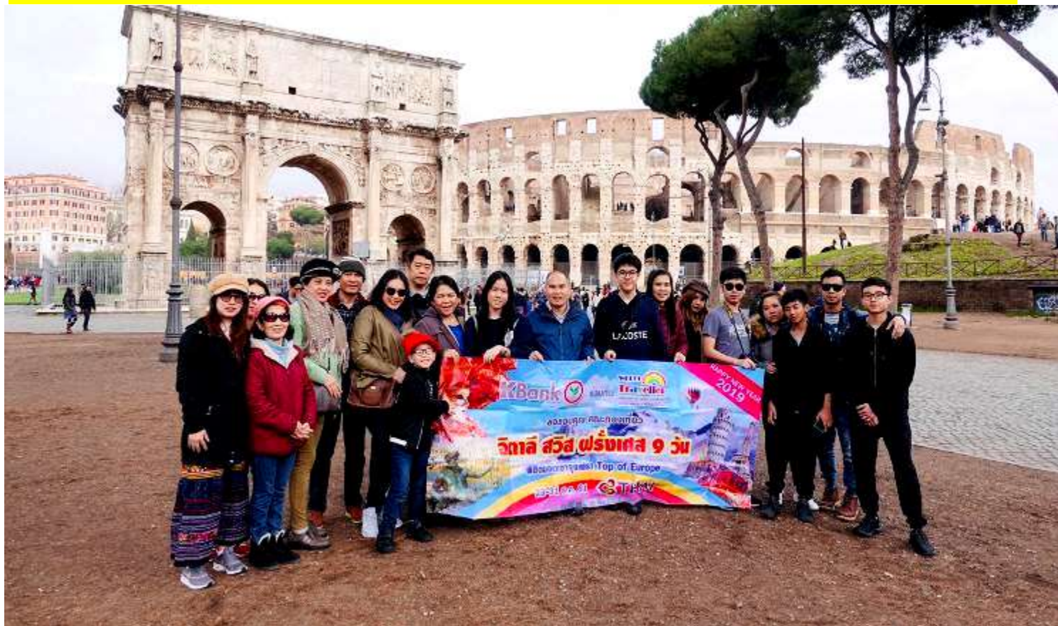
อิตาลี-สวิตเซอร์แลนด์-ฝรั่งเศส 10วัน TG DELUXE เดินทางปีใหม่ 22-31ธ.ค.2561(จำนวน20ท่าน)