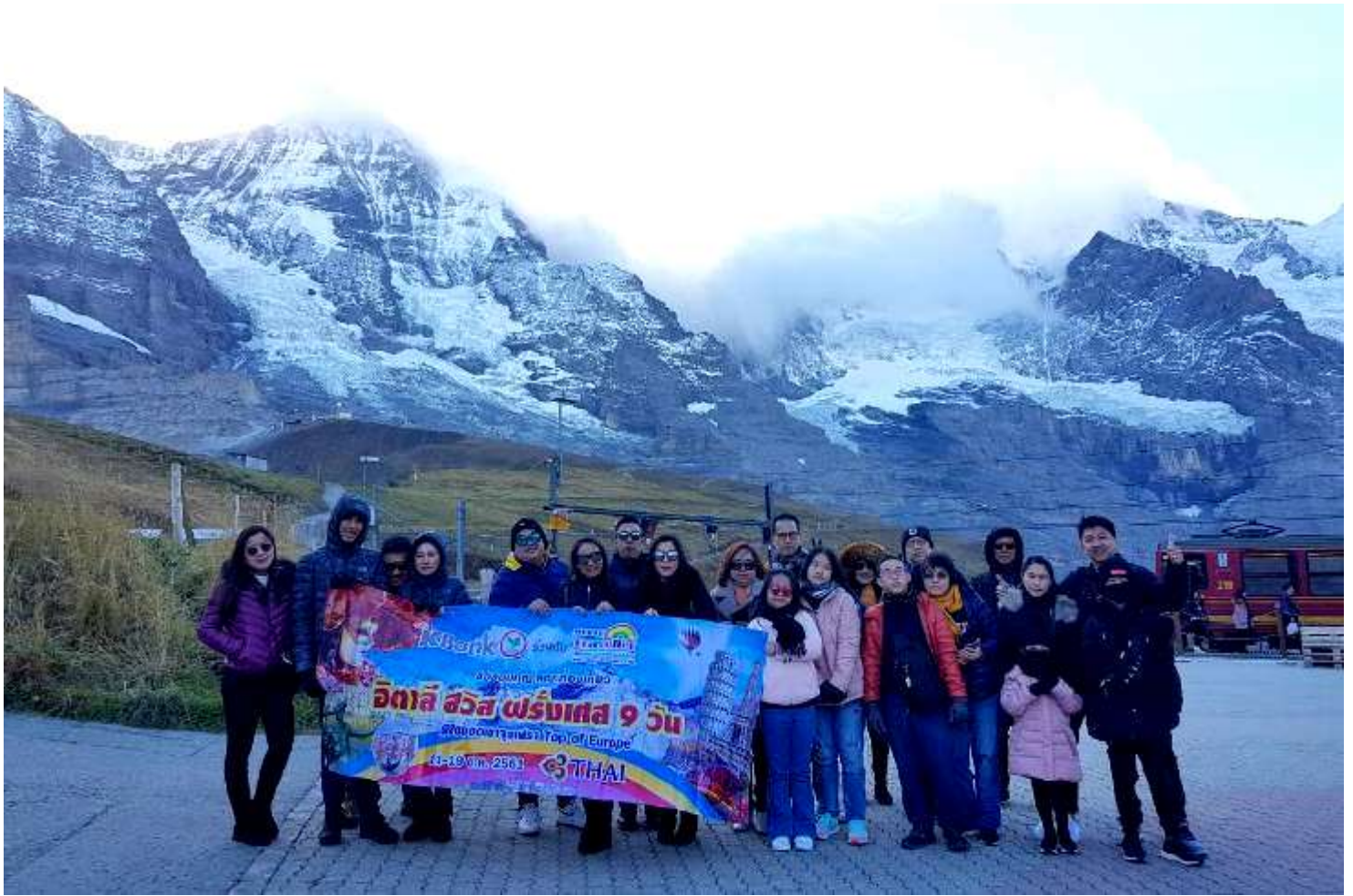
อิตาลี-สวิสเซอร์แลนด์-ฝรั่งเศส 9วัน TG PROMOTION4 เดินทางวันที่ 06-14 ต.ค.2561(จำนวน20ท่าน)