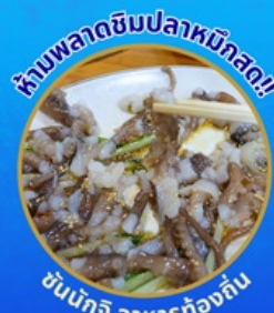
ห้ามพลาดชิมปลาหมึกสด!

โพล้งสเปซวอล์ค สกายวอร์ค ตามรอยซีรีส์ Hometown chachacha ถ่ายรูปชิคๆ หมู่บ้านวัฒนธรรมคิมซอน ขึ้นเคเบิลคาร์ ชมทะเลปูซาน นั่งรถไฟปูคปิก sky capsule ชิมของอร่อยตลาดแฮนแด อิสระช้อปปิ้ง Lotte Duty Free