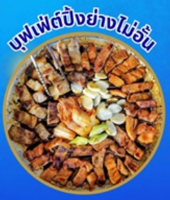
บุฟเฟต์ปิ้งย่างไม่อั้น