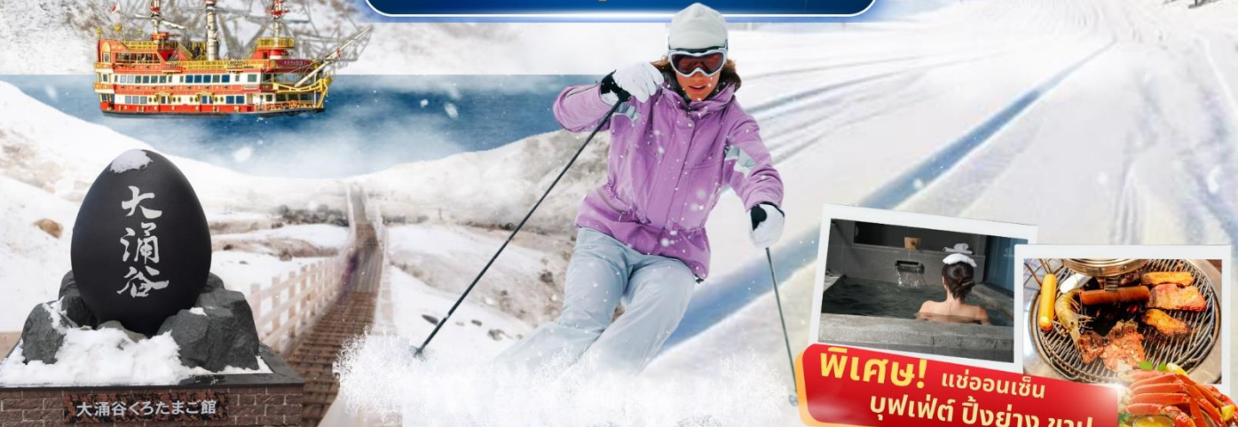
大涌谷くろたまご館