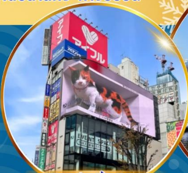
อิสระช้อปปิ้ง ชิโนจุกุ