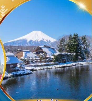
หมู่บ้านน้ำใส