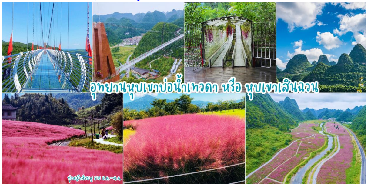
อุทยานหุบเขาบ่อน้ำเทวดา หรือ หุบเขาเสินฉวน

เช้า |๑|รับประทานอาหารเช้า ณ ห้องอาหารของโรงแรม หลังอาหารเช้าท่านเดินทาง อุทยานหุบเขาบ่อน้ำเทวดา หรือ หุบเขาเสินฉวน (ค่ารถแบตเตอรี่) มณฑลกุ้ยโจว เป็นแหล่งท่องเที่ยวที่คุณจะได้สัมผัส ดื่มด่ำกับธรรมชาติอย่างแท้จริง และสถานที่แห่งนั้นก็คือ “จุดชมวิวกุ้ยเขาเสินฉวน” เป็นสถานที่ท่องเที่ยวสุด UNSEEN ที่ชื่อเสียงของชาวจีน จุดชมวิวกุ้ยเขาเสินฉวน ตั้งอยู่ท่ามกลางธรรมชาติ ขุนเขา ป่าไม้ ธารน้ำและทุ่งดอกไม้ ที่อุดมสมบูรณ์สวยงาม ในเขตปกครองตนเองชนกลุ่มน้อยเผ่าเหมียวและปู้อี้ ฉีเยินหนาน อำเภอฉางชุ่น มณฑลกุ้ยโจวทางตะวันตกเฉียงใต้ของจีน ซึ่งเสน่ห์ที่ชวนดึงดูดให้นักท่องเที่ยวผู้ชื่นชอบธรรมชาติจากทั่วทุกสารทิศอยากจะมาเยือนที่จุดชมวิวกุ้ยเขาเสินฉวนแห่งนี้ นำท่านชมบ่อน้ำเทวดา ลักษณะเป็นบ่อน้ำพลูร้อนที่เกิดขึ้นตามธรรมชาติ เป็นสถานที่ชาวกุ้ยโกวนิยมมาขอพรให้กิจการการงานราบรื่น จากนั้นนำท่านชมวิวกุ้ยเขาที่หยอด โดยสัมผัสความหวาดเสียว ณ สะพานกระจกหุบเขาน้ำพลูเทวดา (รวมค่าบัตรโดยสาร 1เที่ยว) สะพานแก้วมีความยาว 324 เมตร สูง 188 เมตร ให้ท่านได้ชมวิวดงงามด้วยยอดเขาที่หนาแน่นและแปลกตาและภาพรวมที่สมบูรณ์แบบ รูปร่าง ได้รับการยกย่องจากผู้เชี่ยวชาญและนักท่องเที่ยวมากมายว่าเป็น “สิ่งมหัศจรรย์ของโลก” นำท่านชมทุ่งดอกไม้ตามฤดูกาลที่มีความสวยงามแฉะถ้าयरูปตามจุดชมวิวกุ้ยเขา (ในช่วงเดือน พ.ค.-ส.ค.67 ท่านจะได้ชมทุ่งทานตะวันหรือดอกไม้อื่นๆ // ในช่วงปลายส.ค.-ต.ค.67ท่านจะได้ชมทุ่งหญ้าสีชมพู)