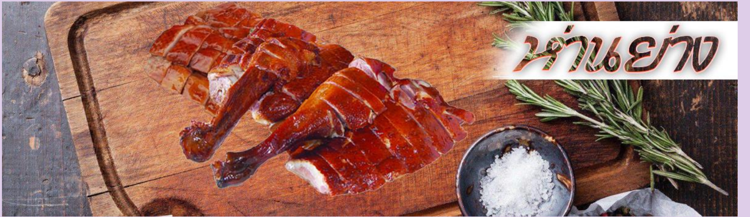
ร้านอาหาร

เที่ยง รับประทานอาหารกลางวัน ณ กัณฑ์ดาตาร ***เมนูท่านอย่างฮ่องกงแสนอร่อย***