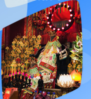
เจ้าแม่กวนอิมซี่มเงิน