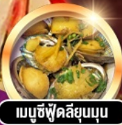
เมนูซีฟู้ดลิ้นจี่นูน