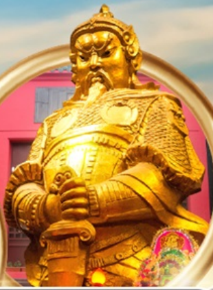
วัดเขกงหนิว