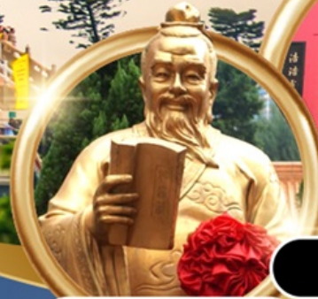
ผูกค้ายแดงขอความรัก