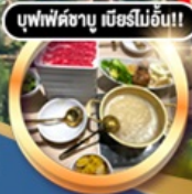
บุฟเฟ่ต์ชาบู เมื่อร์ไม่อิน!!