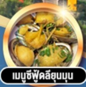
เมนูซีฟู้ดลิขุมบุณ