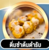
ต้มซ่าคั้นตำรับ