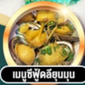
เมนูซีฟู้ดลิขุนบน