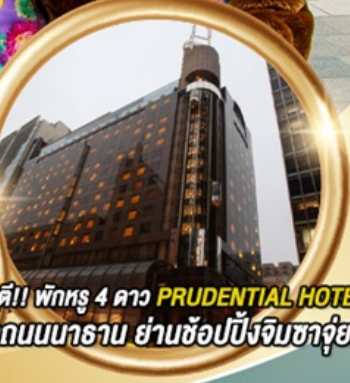
ทาร์นดี!! พักหรู 4 ดาว PRUDENTIAL HOTEL ติดถนนนาธาน ย่านช้อปปิ้งจิมซาจุ่ย