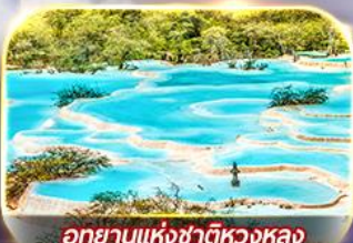
อุทยานแห่งชาติหวงหลง