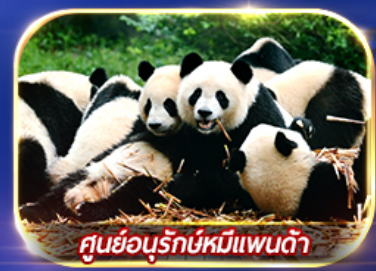
ศูนย์อนุรักษ์หมีแพนด้า