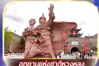
อุทยานแห่งชาติหวงหลง