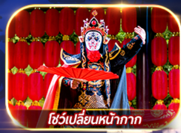
โชว์เปลี่ยนหน้ากาก

สัมผัสความงาม 2 อุทยานแห่งชาติ จิวจ้ายโกวและหวงหลง เมืองโบราณซงพาน ศูนย์อนุรักษ์หมีแพนด้า ชมโชว์เปลี่ยนหน้ากาก