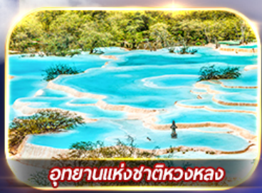
อุทยานแห่งชาติหวงหลง