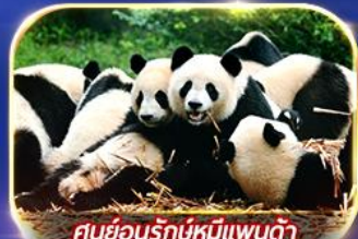
ศูนย์อนุรักษ์หมีแพนด้า