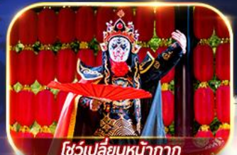
โชว์เปลี่ยนหน้ากาก

สัมผัสความงาม 2 อุทยานแห่งชาติ จิวจ้ายโกวและหวงหลง เมืองโบราณซงพาน ศูนย์อนุรักษ์หมีแพนด้า ชมโชว์เปลี่ยนหน้ากาก