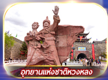
อุทยานแห่งชาติหวงหลง