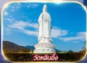
วัดหลินอึ้ง