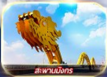
สะพานมังกร