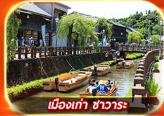
เมืองเก่า ซาวาระ