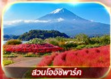
สวนโอบิซังพาร์ค