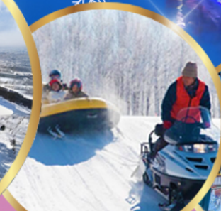
ซิกิไซ สโนว์แลนด์