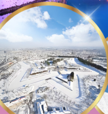
ป้อมโทเรียวคาคุ