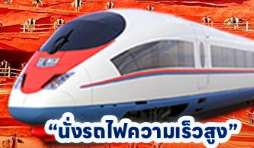
“นั่งรถไฟความเร็วสูง”