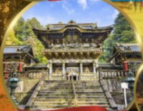
ศาลเจ้านิกโกโทโทกุ