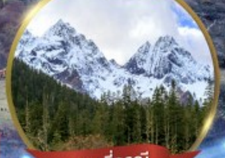
ภูเขาสี่ฤดู