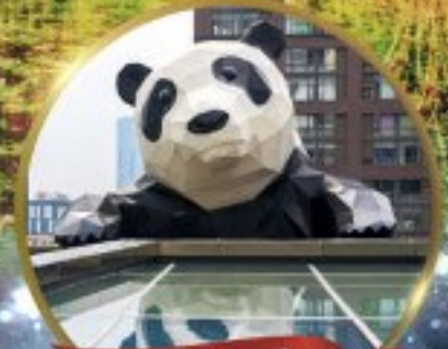
แพนด้ายักษ์

มหัศจรรย์ความงาม อุทยานจิวจ้ายโกว (รวมรถเหมาเที่ยวอุทยานเต็มวัน) ชมอุทยานหวงหลง (รวมกระเช้า) • สี่ฤดู • อุทยานของเขียวโกว (รวมรถอุทยาน) เมืองเก่าชงพาน • ถนนคนเดินจิมหลี่ + ไถ่ตู้หลี่ • ชมแพนด้ายักษ์ป็นตึก