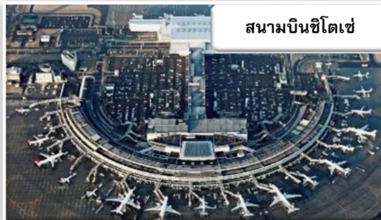
สนามบินชิโตเซ่

บริการอาหารร้อนบนเครื่องพร้อมกับเมนูผลไม้สดเพื่อเติมเต็ม ความพิเศษไปพร้อมๆกับความสดชื่น