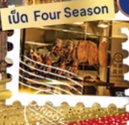
เปิด Four Season