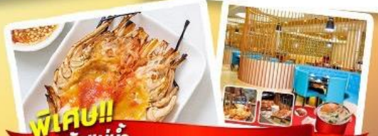
พิเศษ!! ก๊วยแม่น้ำ + HOTPOT SEAFOOD