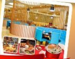
ก๊วยแม่น้ำ + HOTPOT SEAFOOD