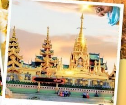
เจดีย์กลางน้ำ (สิริเรียม)