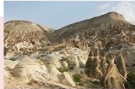
ทูบเขาเดเฟเนิร์ต

** พักที่ DEDELI CAVE HOTEL 5* หรือเทียบเท่า **