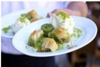
ชิมไอศกรีมตุรกีต้นกำเนิด Nemrut Mountain