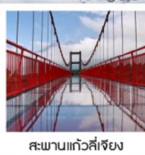
สะพานแก้วลี่เจียง