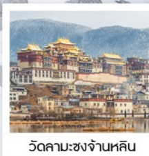
วัดลามะ: ขงจันหลิน