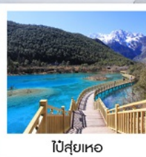
โป๋สุ่ยเหอ