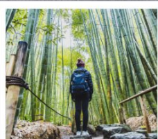
วัดโฮโตะคุจิ