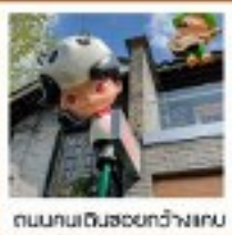
ถนนคนเดินฮอยหว่างเกน