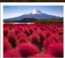
โอชิชิ ฟูจิ