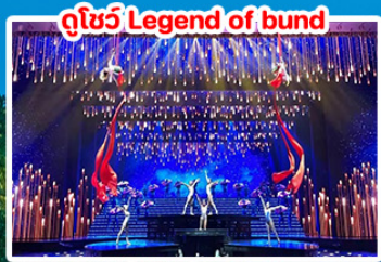
ดูโชว์ Legend of bund