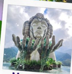
Moana Cafe Sapa