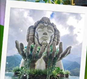
Moana Cafe Sapa