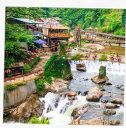
หมู่บ้านก๊อทก๊อต