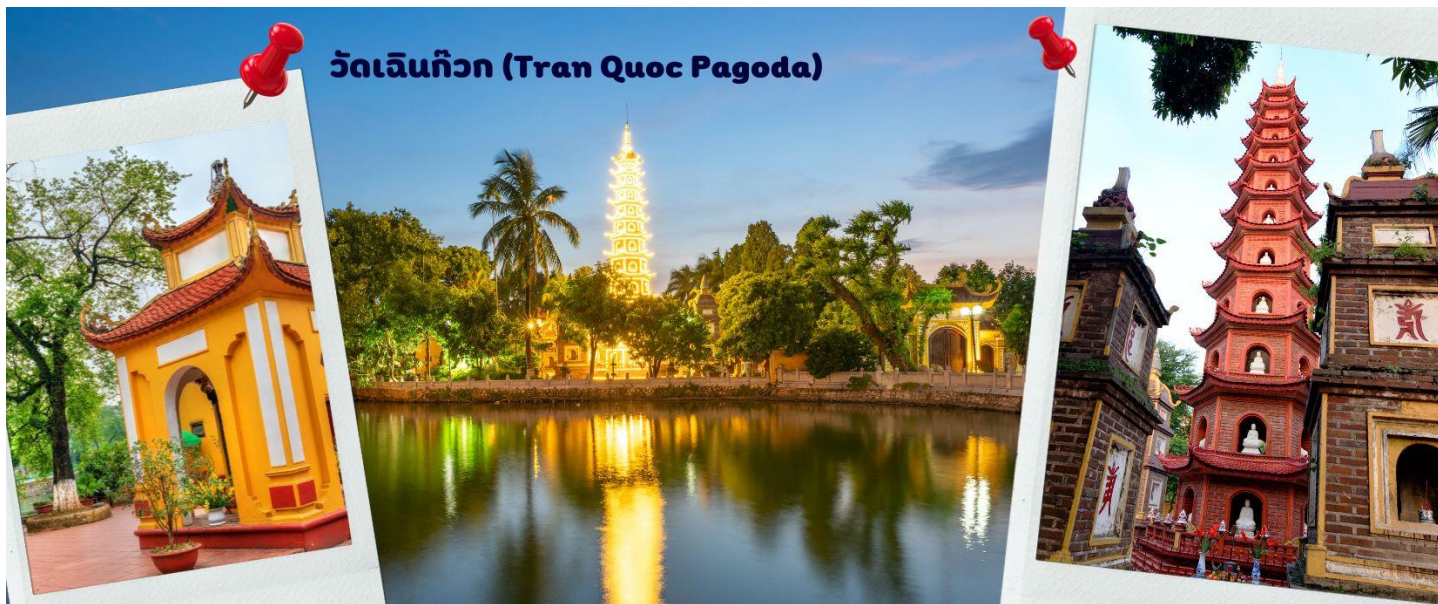
วัดเงินทิวก (Tran Quoc Pagoda)

พระพุทธรูปศาสนา จากภาพมุมสูงของสถานที่ตั้ง ที่นี่เหมือนตั้งอยู่บนเกาะที่ยื่นลงไปในทะเลสาบ แต่มีเส้นทางคมนาคมเข้าถึงที่ สิ่งปลูกสร้างมีการวางผังเป็นอย่างดี ใช้สีสันทึกลมกลืนในโทนสีเหลือง น้ำตาล ตัดกับสีเขียวของต้นไม้ใหญ่ที่โอบล้อมอยู่ ในมุมถ่ายภาพจากอีกฝั่งหนึ่ง จะเห็นสิ่งปลูกสร้างสไตล์จีน และเจดีย์หลายชั้นโดดเด่น มีภาพที่สะท้อนลงสู่ผิวน้ำ เป็นภูมิทัศน์ที่งดงามทั้งยามกลางวันและยามค่ำคืนที่มีการเปิดไฟส่องสว่าง