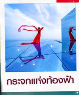
กระเจ๊กท้องฟ้า