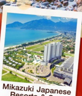
Mikazuki Japanese Resorts & Spa