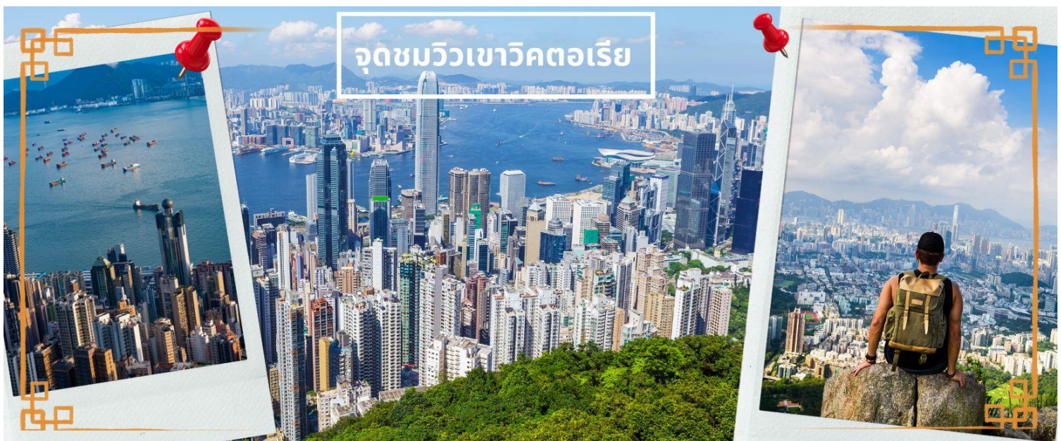
จุดชมวิเขาวิกตอเรีย

จากนั้นเดินทางสู่เกาะฮ่องกง นำท่านขึ้นสู่ จุดชมวิวเขาวิกตอเรีย โดยรถโค้ช ตีร่มดักกับบรรยากาศของฮ่องกงแบบพาโนรามา 360 องศา เป็นจุดชมวิวมุมสูงของฮ่องกง ให้ท่านถ่ายรูปตามอัธยาศัย ตื่นตาตื่นใจกับ