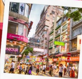
ช้อปปิงย่านมงก๊ก