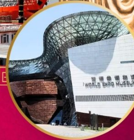
SHA WORLD EXPO MUSEUM