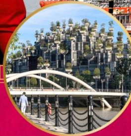
ตึก 1000 TREES