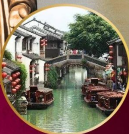
หมู่บ้านโบราณ "ซานถิงเจีย"

วัดหลิงซาน / ศาลาฟานกง(รวมรถราง) หาดไว่ทาน / อุโมงค์เลเซอร์ / หอไข่มุก ถนนนานกิง / วัดพระหยก / ซินเทียนตี้ พิพิธภัณฑ์ผังเมืองเซี่ยงไฮ้ / ตลาด 100 ปี วัดจิ้งอัน(วัดสายมู)