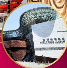
SHA WORLD EXPO MUSEUM