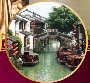
หมู่บ้านโบราณ "ซานถิงเจีย"

วัดหลิงชาน / ศาลาฟานกง(รวมรถราง) หาดไว่ทาน / อุโมงค์เลเซอร์ / หอไข่มุก ถนนนานกิง / วัดพระหยก / ซินเทียนตี้ พิพิธภัณฑ์ผังเมืองเซี่ยงไฮ้ / ตลาด 100 ปี วัดจิ้งอัน(วัดสายมู) ร้านกาแฟ STARBUCKS RESERVE ROASTERY OUTLET FLORENTIA