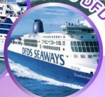
ล่องเรือ DFDS