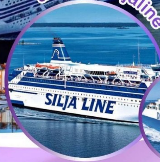
ออกเดินทางปี 2024