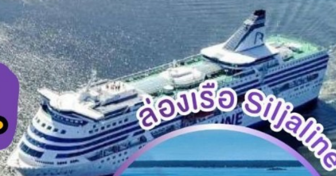
ล่องเรือ Siljaline