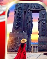
THE CHRONICLE OF GEORGIA