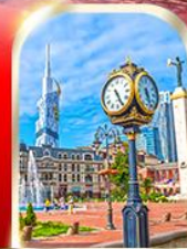
BATUMI CITY ADJARA

เมืองท้ำอุพลิสซิค ■ ป้อมอนาบูรี ■ นั่งกระเช้าชมเมืองบอร์โจนิ อนุสาวรีย์นิตรภาพ รัสเซีย-จอร์เจีย ■ โบสถ์เกอร์เกดี วิหารจวารี ■ มหาวิหารสวตีสคเวลี