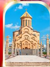
HOLY TRINITY CATHEDRAL